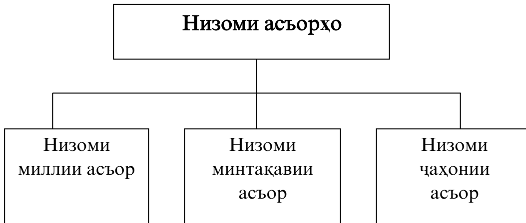
Расми 1. Низоми асбӯро.

Низоми асбӯро аз рӯи марзиву ҳудудӣ ба се қисмат гурӯҳбандӣ намудан мумкин аст (нигаред ба расми 1).