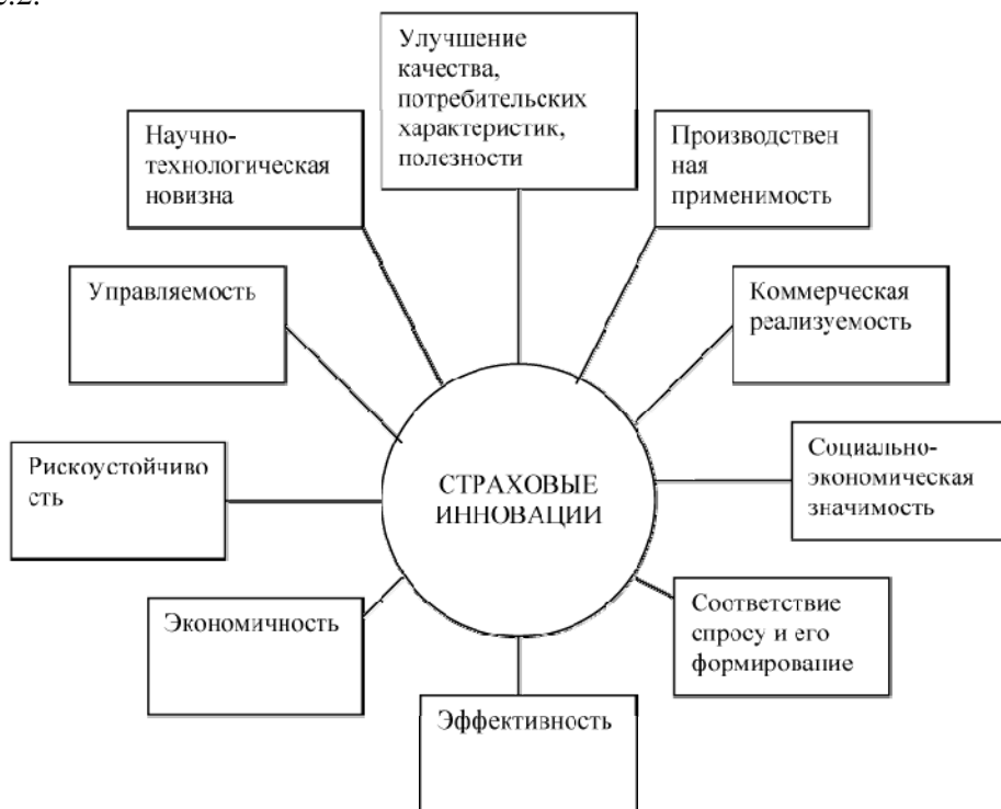
Рис. 2. Характерные черты страховых инноваций

Сущность и содержание инноваций в страховом бизнесе базируются на методологических основах инновации, учете свойств и функций инноваций, законов и закономерностей инновационных процессов, специфике управления инновационной деятельностью и др. Основные свойства страховых инноваций, их характерные черты представлены на рис.2.