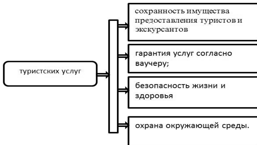
Таблица 1. Качества туристских услуг

Таким образом, туристские услуги представляют крупный сегмент сферы услуг, обеспечивающих удовлетворение потребностей людей и реализацию их деятельности в свободное время: отдых, развлечения, путешествия. По роли в структуре туристского потребления различают: