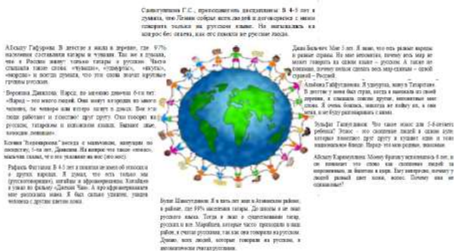
Рис1. Ментальная карта представлений студентов группы 14.5-380 о происхождении языков

География, как традиционная школьная дисциплина, должна внести свой вклад в формирование багажа знаний современного ученика. Усилия преподавателей географии